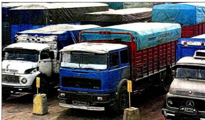
Los aumentos en los fletes pasarán a tener un fuerte peso en la producción del Norte

Los nuevos cuadros tarifarios fueron establecidos por la Subsecretaría de Transporte de la Nación, luego del bloqueo que la Federación