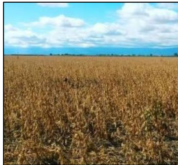
Cuadro de soja de primera con buen potencial de rinde. Valle de Conlara, San Luis (09-05-16).

La cosecha de soja avanzó lentamente sobre la región Núcleo Norte, mientras que sobre el Núcleo Sur y el Centro-Este de Entre Ríos se relevaron importantes progresos en la recolección de lotes de primera y segunda ocupación. En estas dos zonas, los promedios de rinde se redujeron a 37 y 20,5 qq/Ha respectivamente. En paralelo, la región Centro-Norte de Córdoba registró un importante avance de cosecha, con un rendimiento regional que se mostró